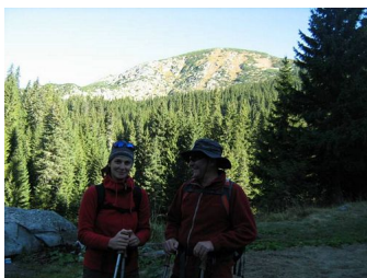
Lacul Bucura, foto de lângă Salvamont